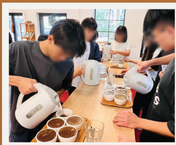
▲ 學習和認識沖煮咖啡的基本技巧