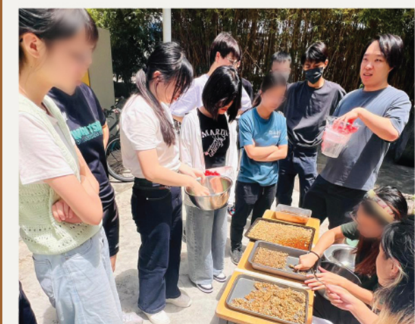
▼ 模擬咖啡農處理咖啡豆的方法