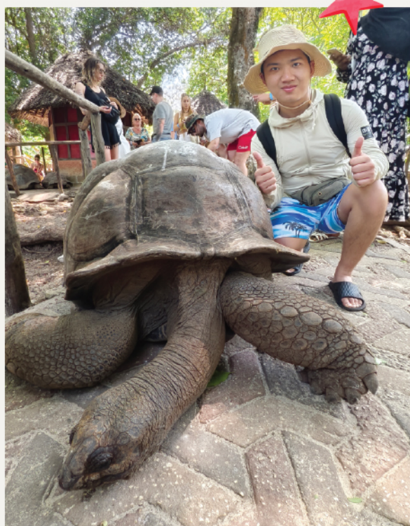
▲ 與阿爾達布拉老龜合照

我在 坦桑尼亞 的時光，徹底改變了我對消費和物質需求的看法。見證那些擁有豐富文化生活和緊密社會結連的社區，擁有的物質卻遠少於我慣常所擁有的，讓我開始質疑自己許多消費的必要性。旅途中幾乎沒有廣告和購物機會，給了我心靈空間去思考什麼才是真正帶來幸福和滿足的事物。