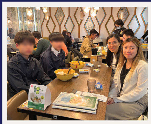
▲ 與同學社區探索後一起晚膳