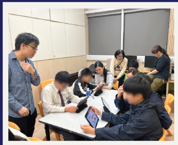
▲ 與同學一起共學，製作手機App

在這計劃中，我好像經歷了一趟「摘星之旅」，看著每顆一閃一閃的小星星，彷彿在有笑有淚的世界之中，努力地尋找自己成長的天空，期盼每一位孩子也能遇見懂欣賞他們的人，發現其獨特光芒，一起變得更光更亮。最後，我衷心鼓勵大家參加師友同行計劃，讓溫暖延續下去，讓友愛生生不息……。