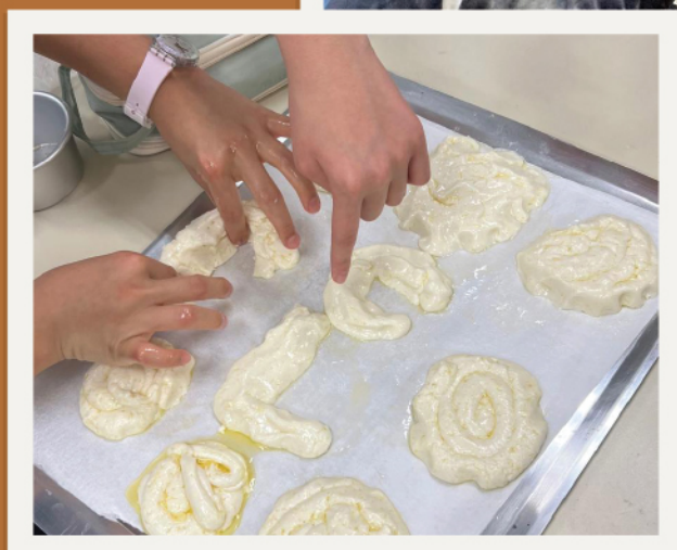
▲ 不同花式的甜品，突顯了孩子們的創意