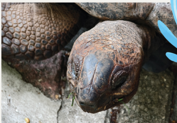
▲ 在監獄島遇見過百年的阿爾達布拉老龜