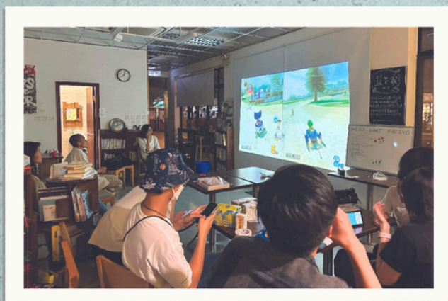
▲ 告別日前一齊打機